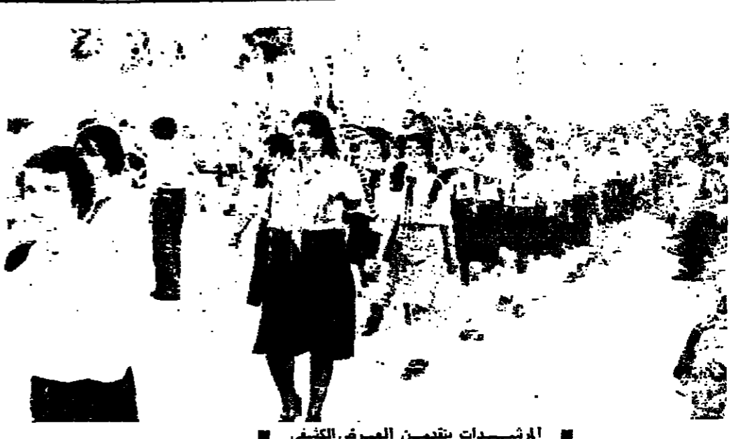
المرشدات يتفحصن العرض الكشفي